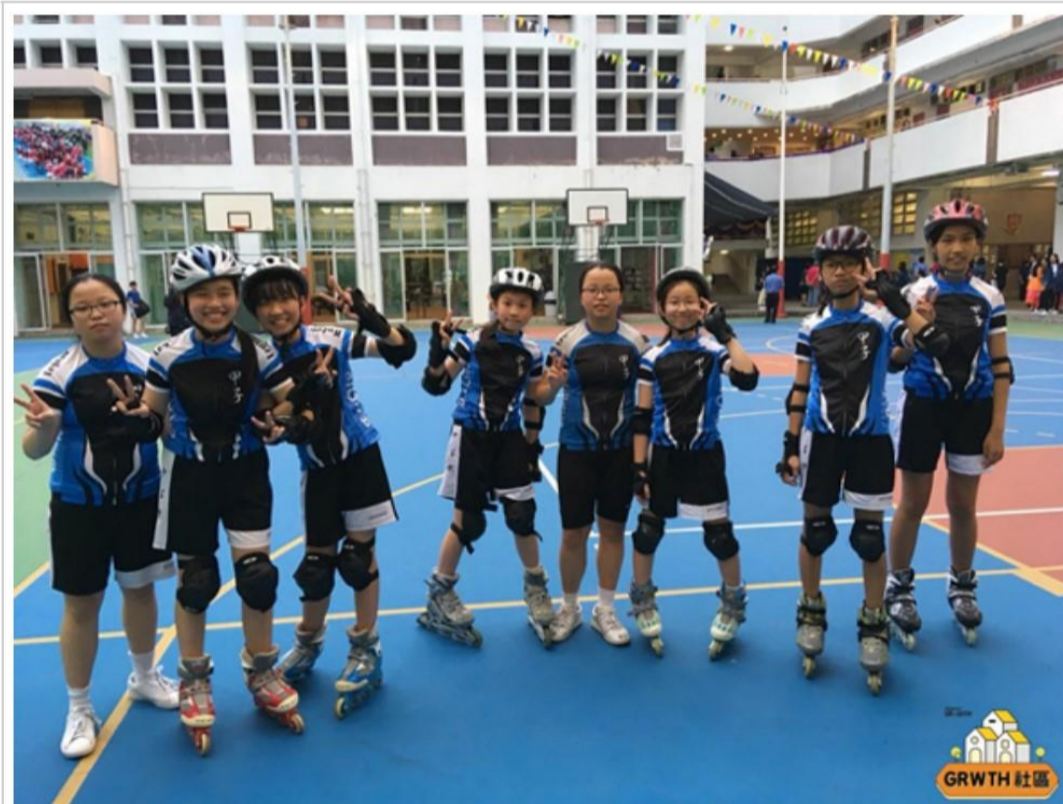
計劃讓沉默少女變成自信的滾軸溜冰選手

不過，成績只是其次。「更重要的是，陪佢地一齊尋夢，一齊accomplish。」東Sir說現今的年青人物資不缺，但難感受幸福，缺乏讓生命圓滿的五大元素，包括Positive Emotion正向情緒、Engagement全心投入、Relationship人際關係、Meaning意義及Accomplishment成就感。這五大元素就是「正向教育」的核心價值。