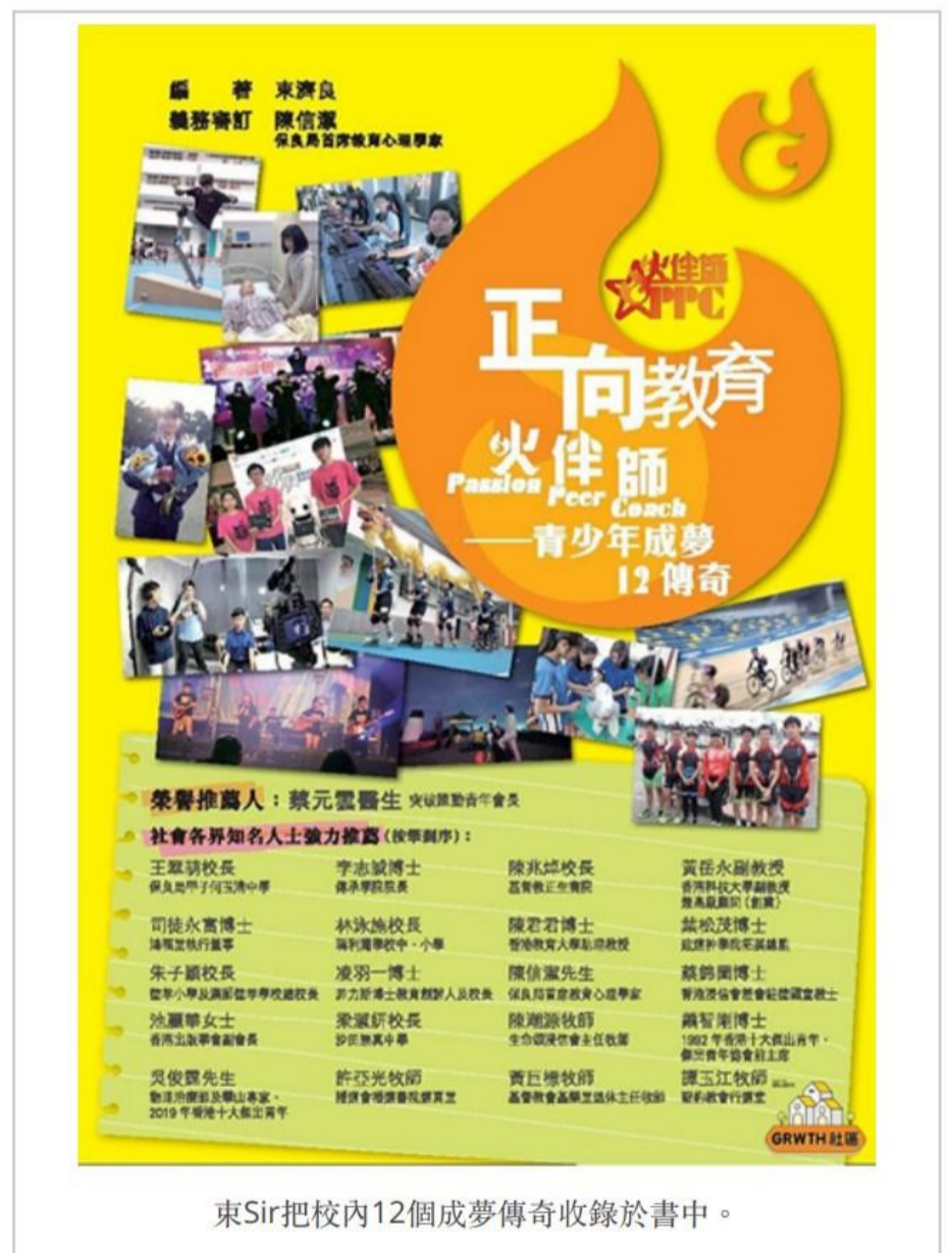
東Sir把校內12個成夢傳奇收錄於書中。

成夢之外，連帶學生的個人操行和成績也跟著進步，亦令父母另眼相看。「家長平時見子女眼火爆，但睇佢哋比賽，冇想過可以咁專注，當刻覺得好自豪。」東Sir說。