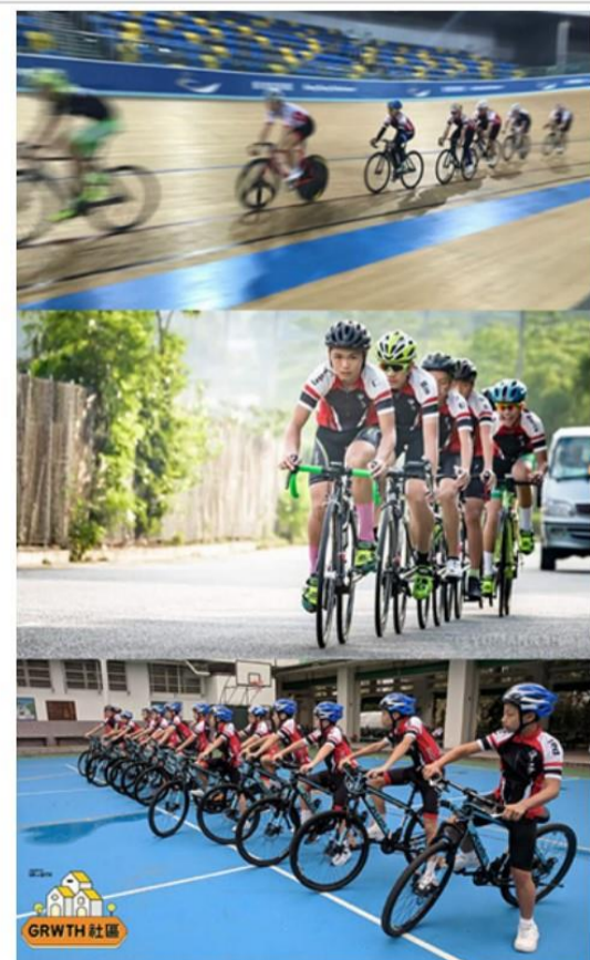
單車隊的訓練涵蓋場地單車、公路單車及山地單車。