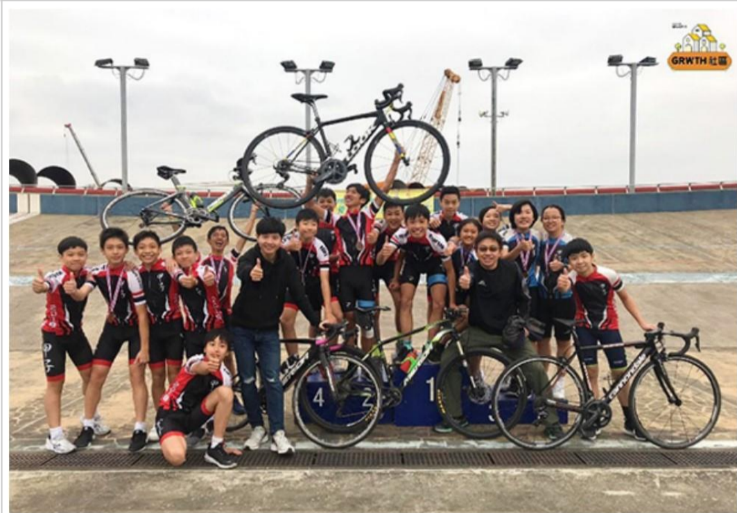
單車隊成軍至今五年，共贏得三屆學界冠軍。

師生同心，很快便看到成績。之後那場比賽，不但全隊過關，更有隊員奪得第三名。其後，單車隊獲獎連連，成軍至今五年，共贏得三屆學界冠軍，成績驕人。